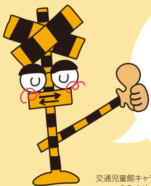
交通児童館キャラクター ふみきりこさん