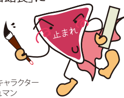
交通児童館キャラクター とまれマン

ただいま「交通安全・交通事故の防止」をテーマにした一句(5・7・5)を募集中! 優秀作品は、あきまつり「交通安全クイズ大会」内で掲示・表彰式を行いますので、ぜひご応募ください! 優秀者は当日「1日館長」に就任してもらう予定です